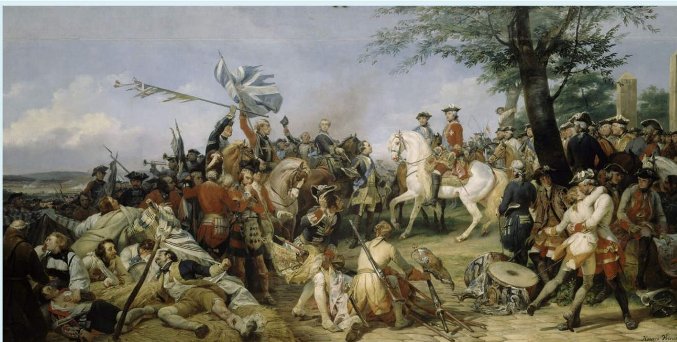
De slag bij Fontenoy, 11 mei 1745, een schilderij van Emile J. H. Vernet (1789-1863)

Rausa-lezers hebben wellicht al moeten vaststellen dat de Villaretkaart geen gegevens bevat voor het werkgebied van Rausa. De hele zone tussen de Midden-Dender (van Aalst tot Ninove) in het westen en de oude heirbaan/steenweg Asse-Edingen is om onduidelijke redenen een blinde vlek gebleven op de netkaart.