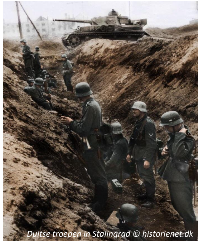
Duitse troepen in Stalingrad