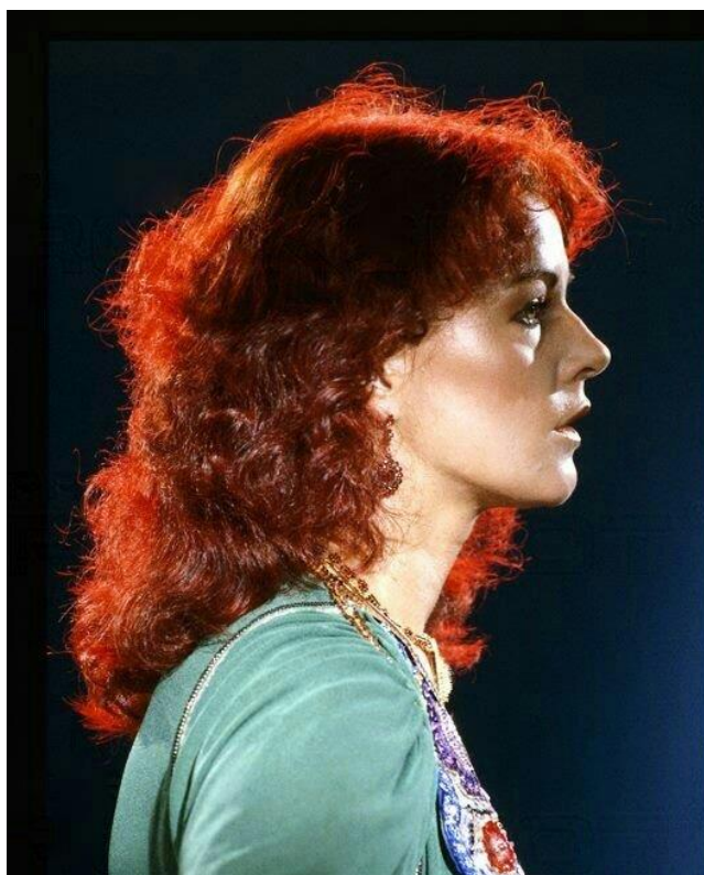
Anni-Frid Lyngsted

Omdat alle documenten op het einde van de oorlog werden vernietigd, is het heel moeilijk een getal te plakken op het aantal kinderen dat bij Lebensborn ter wereld is gekomen. Wij weten wel dat de instellingen bij voorkeur in Noorwegen werden ingericht. Volgens Himmler was iedereen daar blond en heeft iedereen daar blauwe ogen, dus dat potentieel mocht niet verloren gaan. Er is sprake van een tiental vestigingen in Noorwegen. Misschien een merkwaardig voorbeeld in dit verband: Anni-Frid Lyngsted, beter bekend als Frida van Abba, is een Lebensbornkind. Ik breng haar tragische verhaal ook in mijn boek.