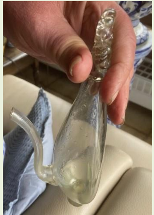
Een donderglas, daterend uit einde 18 de eeuw

Hoe dan ook, een gevoelige daling van de luchtdruk is vaak de voorbode van storm. En met storm op komst kon maar beter, indien mogelijk, een veilige haven worden opgezocht of er werd niet uitgevaren.