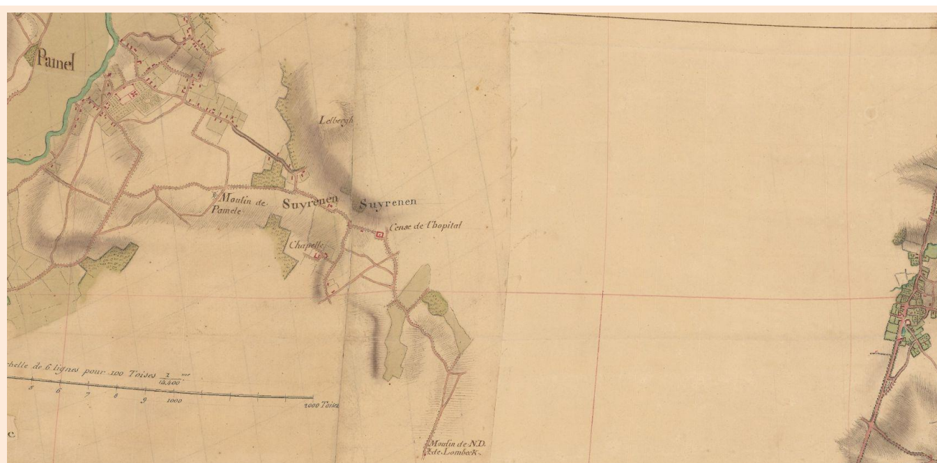
Netkaart op schaal 1:14.400