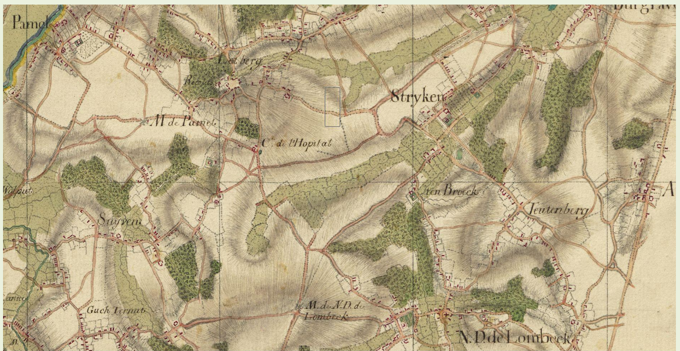
Reductie op schaal 1:28.800 (© SHD Vincennes). Deze reductie is gebaseerd op de minuut op schaal 1:14.400. De minuut geeft iets meer details, maar de inkleuring van de reductie maakt de kaart leesbaarder.