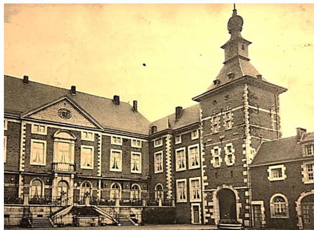
Het kasteel van Wégimont zoals het eruitzag in 1943

Toevallig kwam ik terecht bij een Frans auteur die een uitgebreid hoofdstuk in zijn boek weidde aan een 'afdeling van Lebensborn' in België, in het Ardense dorp Wégimont, waar in 1943 in het statige renaissancekasteel een Lebensborn-kraamkliniek werd opgericht.